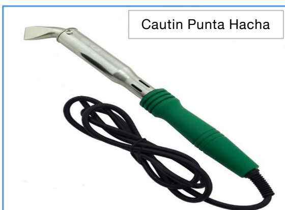
Cautin Punta Hacha