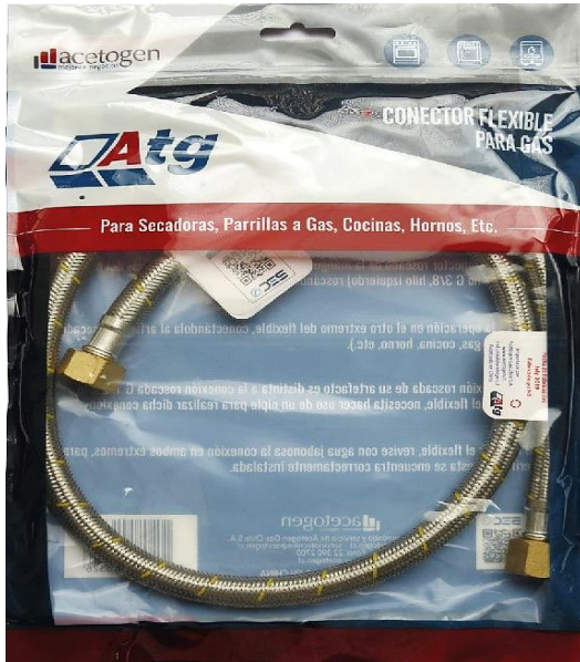
Flexible Gas CERTIFICADO