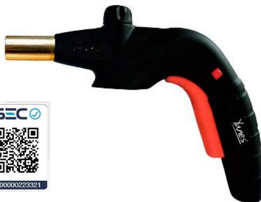
Soplete 4001 K