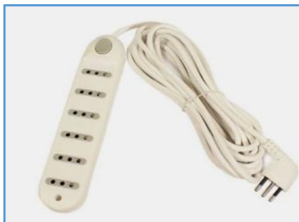
Alargador 6 posiciones