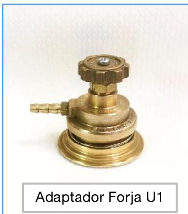
Adaptador Forja U1