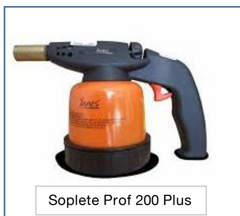
Soplete Prof 200 Plus