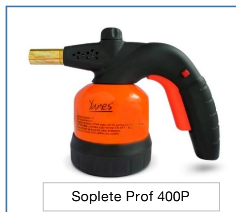
Soplete Prof 400P