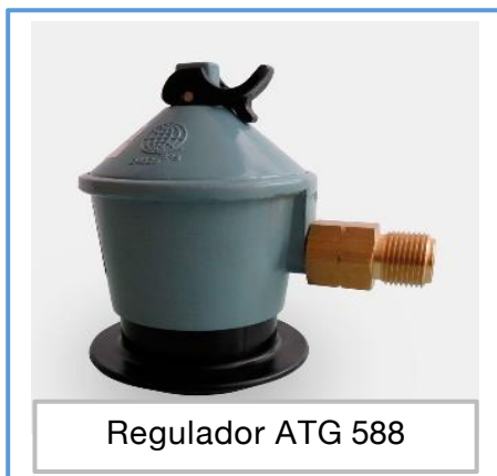
Regulador ATG 588