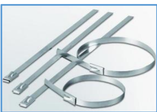
Amarra Acero Inoxidable