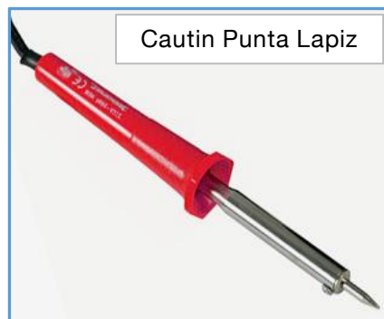
Cautin Punta Lapiz