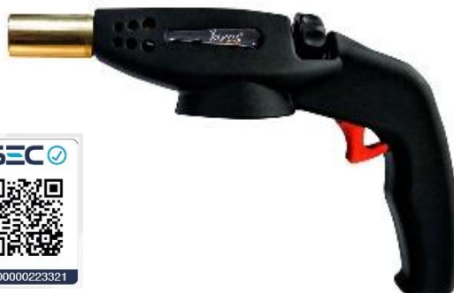
Soplete 2001 K