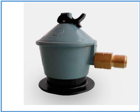
Regulador ATG 588

Regulador ATG 588 - Salida Gas GLP Roscada HE 3/8" Hilo Izquierdo. - Diseñado para ser utilizado en cilindros de 5, 11 y 15 Kg de todas las marcas de gas licuado. - Incorpora seguridad adicional gracias a su válvula de seguridad. - Puede ser utilizado en todos los artefactos a gas licuado de uso doméstico.