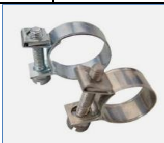
Mini con perno