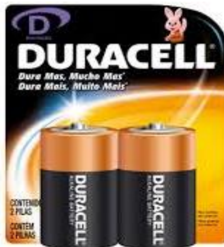
Pila D (Calefon)