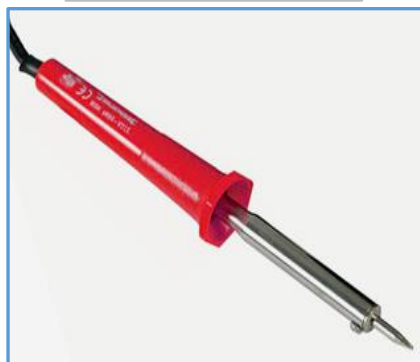
Cautin Punta Lapis