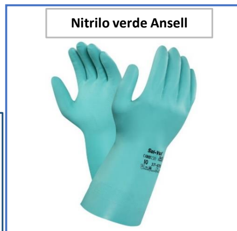
Nitrilo verde Ansell