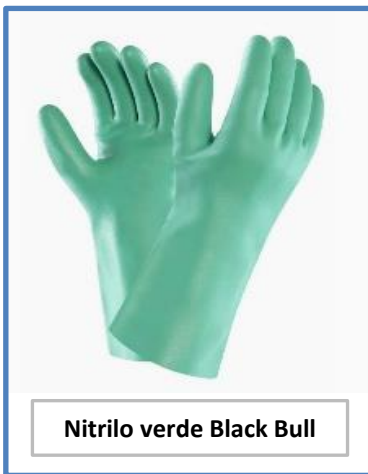
Nitrilo verde Black Bull