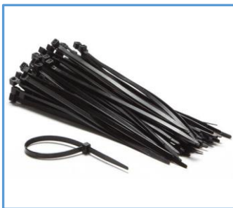
Amarra Nylon Negra