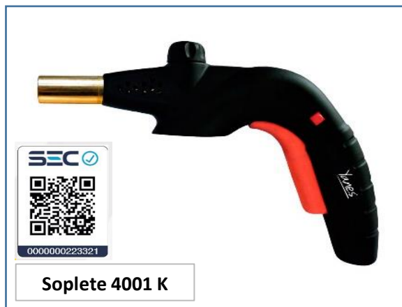
Soplete 4001 K