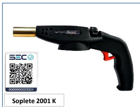
Soplete 2001 K