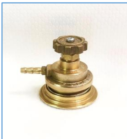
Adaptador Forja U1